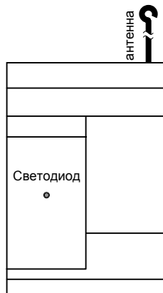
Рис. 1. Внешний вид приемника

75 x 120 x 32 мм (без антенны) 75 x 265 x 32 мм (с антенной)